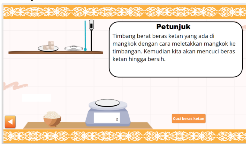
Gambar 1. Simulasi pembuatan Baram

Bahan ajar yang dirancang untuk memfasilitasi aktivitas belajar peserta didik pada peristiwa eksotermik yaitu menyimak video tentang Baram Pali dan video pembuatan Baram, kemudian melakukan simulasi pembuatan Baram. Baram Pali adalah baram yang dikonsumsi setelah ritual Tiwah selesai dilaksanakan. Selanjutnya, peserta didik menyimak video tutorial pembuatan baram, selanjutnya melakukan simulasi pembuatan baram pada virtual lab sederhana. Simulasi yang dimaksud yaitu representasi dari proses pembuatan baram di dunia nyata.