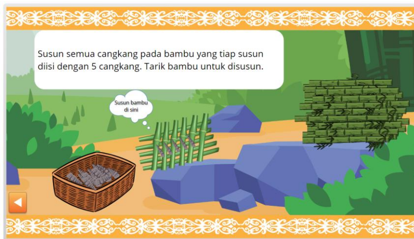
Gambar 2. Simulasi pembuatan kapur sirih

sirih. Manyipa (menginang atau menyirih) biasanya dilakukan dalam berbagai tradisi orang Dayak, baik itu untuk menyambut tamu, berkumpul bersama sanak saudara, bahkan acara adat istiadat seperti pernikahan, kelahiran, kematian. Salah satu bahan manyipa adalah kapur sirih. Selanjutnya, peserta didik menyimak video tutorial pembuatan kapur sirih dari cangkang siput air tawar. Setelah peserta didik menyimak video, selanjutnya melakukan simulasi pembuatan kapur sirih. Simulasi yang dimaksud yaitu representasi dari proses pembuatan kapur sirih di dunia nyata.