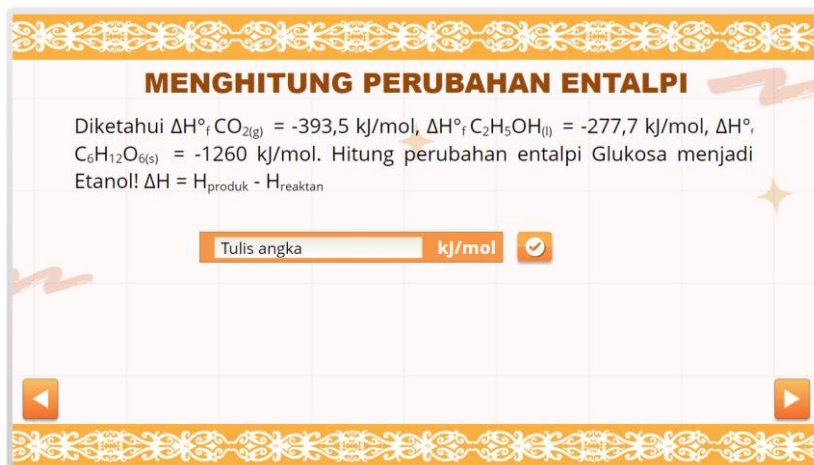
Gambar 3. Latihan soal menghitung perubahan entalpi

Bahan ajar yang dirancang untuk memfasilitasi aktivitas belajar peserta didik pada perhitungan perubahan entalpi pembentukan standar, yaitu memperhatikan contoh-contoh yang diberikan kemudian latihan menghitung perubahan entalpi berdasarkan entalpi pembentukan standar dari pembuatan baram dan pembuatan kapur sirih.