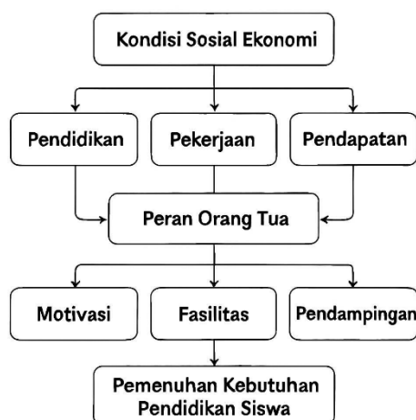
Gambar 2. Model Diagram

Kondisi sosial ekonomi menentukan kapasitas keluarga dalam menyediakan sumber daya pendidikan. Keluarga dengan SES rendah memiliki keterbatasan akses pendidikan (Bradley & Corwyn, 2002). Peran orang tua menjadi penghubung penting yang dapat memperkuat atau mengurangi dampak keterbatasan ekonomi. Dalam konteks SMK, kebutuhan praktik membuat pengaruh ekonomi menjadi lebih signifikan dibanding sekolah umum.