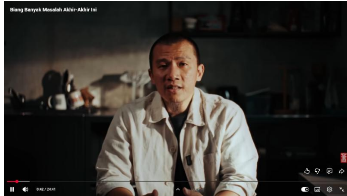
Gambar 3. Screenshoot Video Konten Dakwah Felix Siauw "Biang Banyak Masalah Akhir-Akhir Ini"

Sejumlah preferensi ini mengindikasikan bahwa audiens muda tidak hanya tertarik pada pesan keagamaan normatif, tetapi juga pada dakwah yang menyentuh dimensi moral dan keadilan sosial. Disamping itu hal tersebut juga memperlihatkan adanya pergeseran orientasi dakwah dari ritualistik menuju sosial-etik. Tidak hanya mencari legitimasi teologis, generasi muda juga mencari justifikasi moral terhadap realitas global yang mereka saksikan melalui media digital.