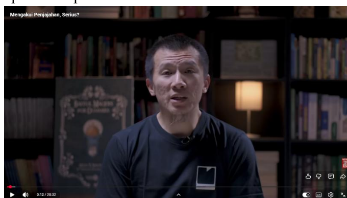
Gambar 1. Screenshoot Video Konten Dakwah Felix Siauw “Mengakui Penjajahan, Serius?”

Dari gambar 1. Video Konten Dakwah Felix Siauw “Mengakui Penjajahan, Serius?”, diketahui aktivitas menonton informan cenderung meningkat ketika topik video dianggap relevan dengan isu sosial terkini atau peristiwa global yang sedang menjadi perhatian publik.